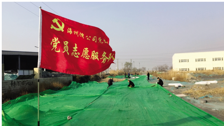
台北投资公司党员志愿服务队全员出击,主动节假日休息日,累计三百余人次奔赴临达公司、海州湾工业园等区域重战“蓝天保卫”,对近千亩土地进行全面检查,对防尘网破损地块,重新铺设、修补缺口。